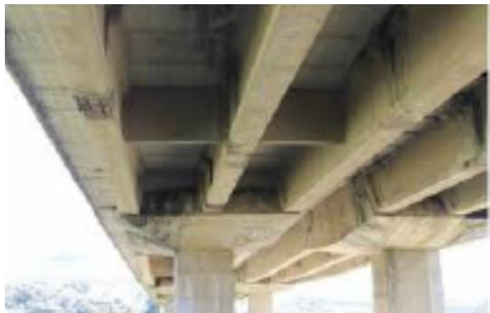
Figura A.1 – Impalcato tipico di Ponte a travata in c.a.p. con sezione aperta e travi parallele

Con riferimento al caso di Figura A.1 , che rappresenta l'impalcato di un tipico ponte a sezione aperta con travi parallele, l'esempio di identificazione riportato nel seguito a titolo meramente indicativo, e comunque non esaustivo, è inteso a meglio illustrare la sequenza di scomposizione in sottoelementi e lo schema per la loro identificazione ( Figura A.2 ). I sottoelementi devono essere accompagnati da opportune misure (m o m 2 ), utili per la valutazione dell'estensione del degrado e dei costi di ripristino.